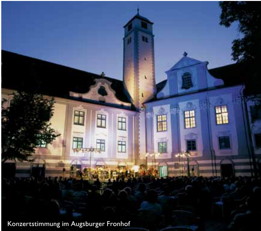
Konzertstimmung im Augsburger Fronhof